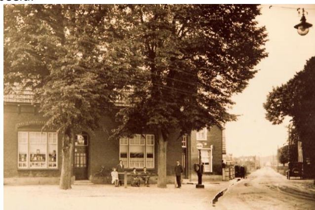
Café 'Hoek van Holland' met winkel en benzinepomp eind jaren twintig

Eind jaren negentig was aan schaalvergroting niet te ontkomen en in 1997 startte taxicentrale Maasbuurt waarin Boxmeer, Cuijk, Mill, St. Anthonis en Gennep (Vullings) participeerden. Een grote organisatie. Henk en zijn vrouw Corrie, die meewerkte in het bedrijf, stopten in 1998 met het vervoer. De naam ‘Vullings’ bijna 100 jaar lang geassocieerd met het café, het tankstation, de taxi's en bussen vervaagde in het dorpsbeeld.